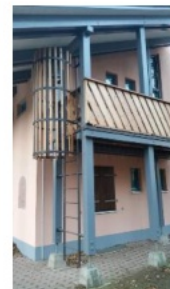
Fluchtleiter vom Balkon, der von den Schlafräumen erreichbar ist