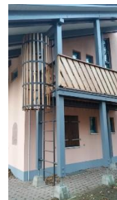
Fluchtleiter vom Balkon, der von den Schlafräumen erreichbar ist